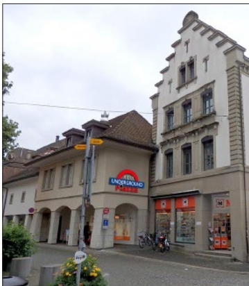
Gesamtansicht Jelmolige Gebäude